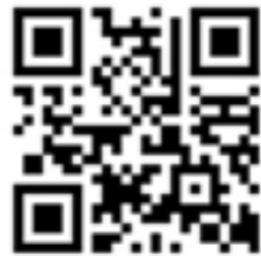
会場地図 QR コード